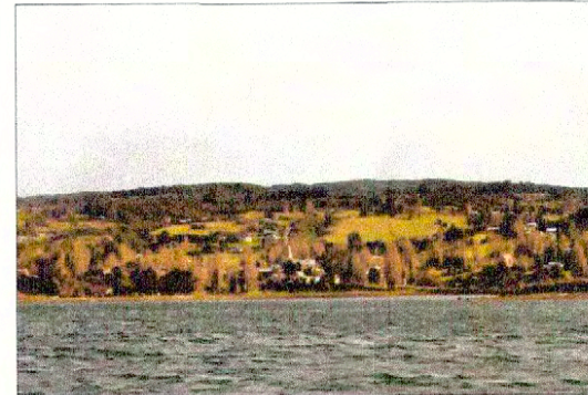
Vista hacia Nercón desde el mar.