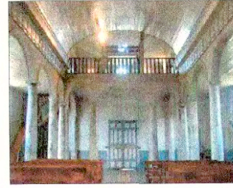
Interior Iglesia Nuestra Señora de Gracia de Nercón