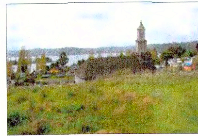
Vista panorámica Iglesia y Canal Gamboa.